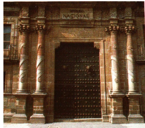
Fachada del museo

Durante este mismo siglo adquirieron importancia las ciencias naturales y las humanísticas, el acervo del Museo se enriqueció y aumentó el número de estudiosos. Gracias a este desarrollo las disciplinas científicas se especializaron y las colecciones crecieron a tal grado que la sección de Historia Natural tuvo que trasladarse en 1909 al Museo del Chopo. Gran parte de las piezas de exhibición salieron del edificio de Moneda, que cambió su nombre por el de Museo Nacional de Arqueología, Historia y Etnografía. Desde ese momento el museo fue considerado como espacio de reunión de estudiosos de la historia mexicana.