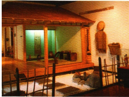
Sala de Japón