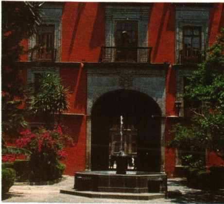
Fuente. Patio principal

Inicialmente las colecciones estaban formadas por objetos donados por los gobiernos de las naciones extranjeras; sin embargo, el acervo era de muy diversa procedencia. Los fundadores del nuevo museo promovieron el canje, la donación y la compra de nuevas colecciones para enriquecerlas salas.