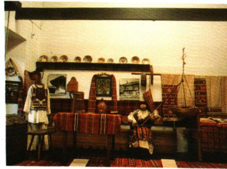
Sala de Rumania

Sala de Africa. Las impresionantes máscaras y tallas en madera permiten explicar la riqueza cultural del África subsahariana a través de los rituales de iniciación y la presencia de sociedades secretas. Se explican también aspectos de su historia que marcaron diferencias regionales.