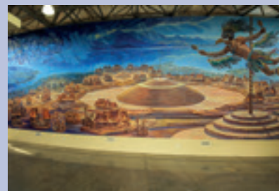
Mural del pintor y acuarelista michoacano Jorge Monroy.

Dentro del sitio se destacan tres estructuras: El Guachimontón, La Iguana y El Azquelite.