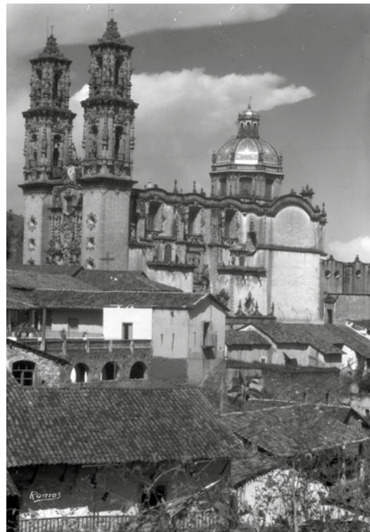
La iglesia de Santa Prisca, en Taxco, es una obra maestra del arte barroco novohispano.