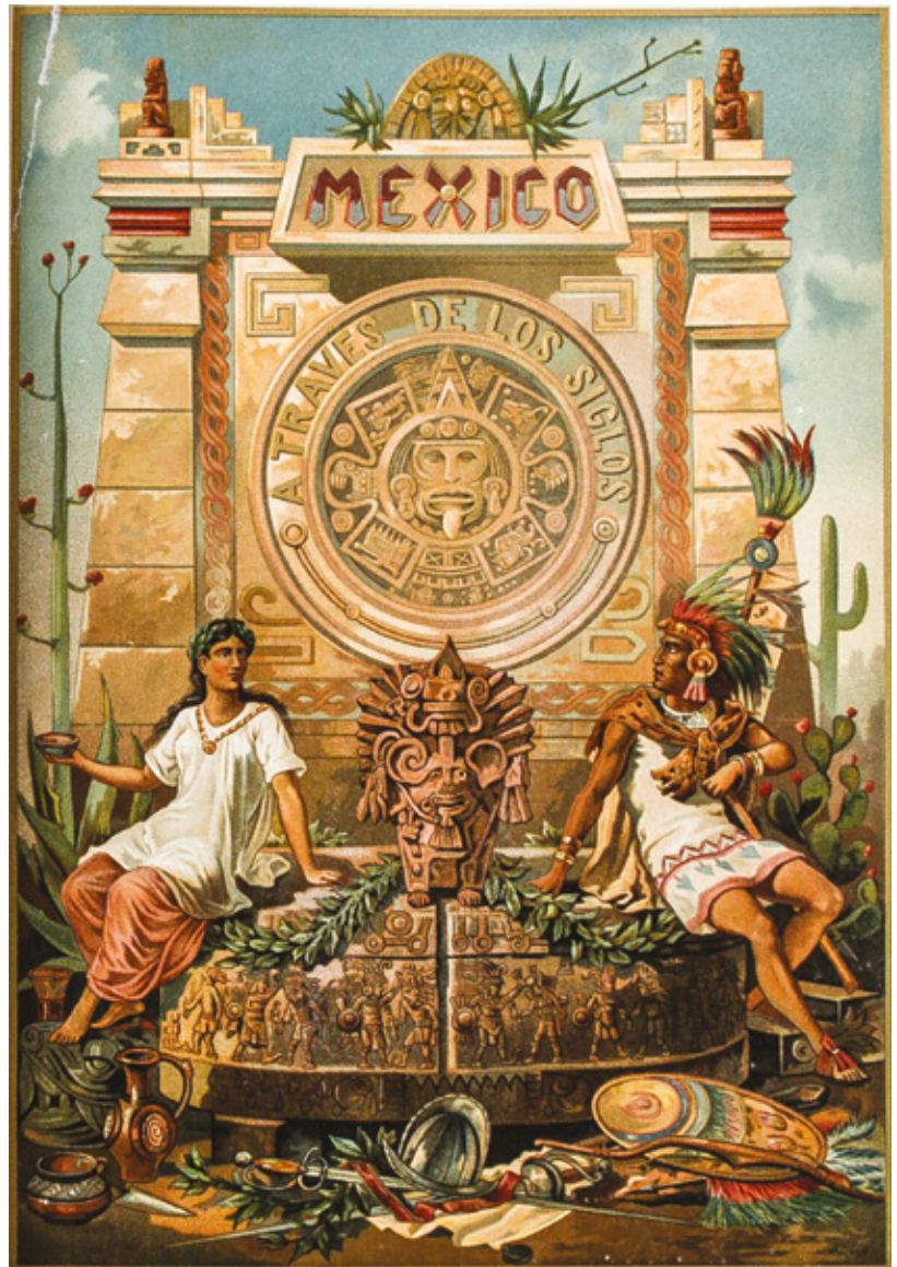
CAT. 22 Vicente Riva Palacio (director) México a través de los Siglos 1884-1889 México, Ballescá y Compañía