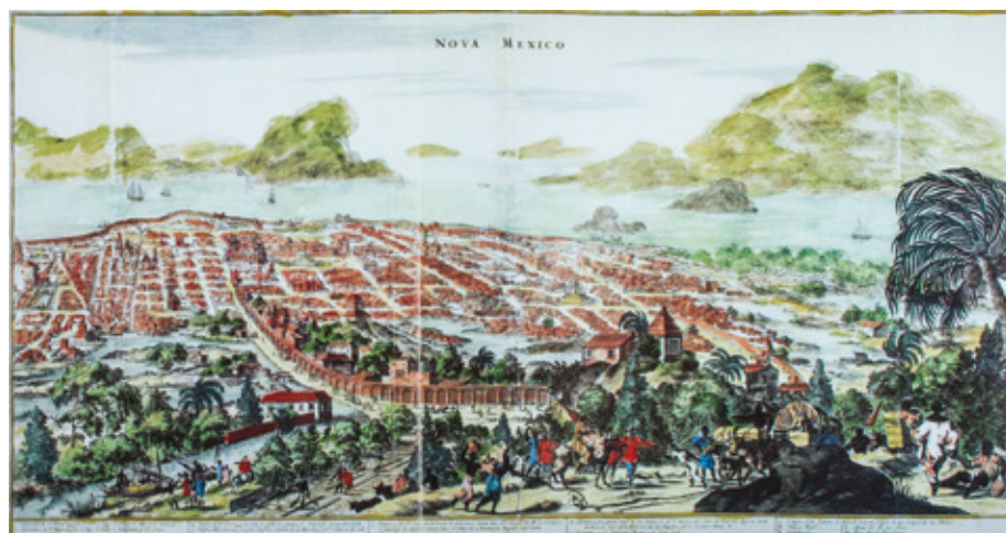
CAT. 44 Sonia Lombardo de Ruiz Atlas histórico de la Ciudad de México 1996 México, CONACULTA-INAH, Smurfit Cartón y Papel de México

Con la creación del Instituto Nacional de Antropología e Historia en 1939, la investigación histórica se vio reforzada, logrando así resultados importantes desde la segunda mitad del siglo XX hasta nuestros días, como se puede apreciar en esta muestra.