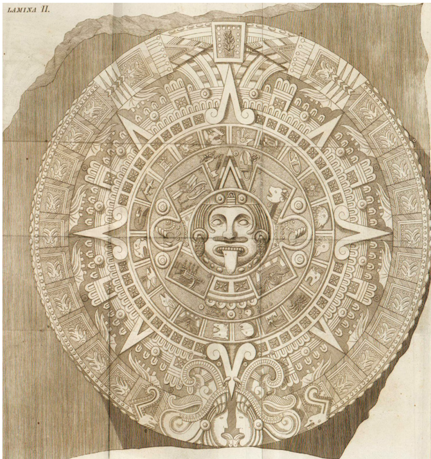
CAT. 1 Antonio de León y Gama Descripción Histórica y Cronológica de las Dos Piedras 1792