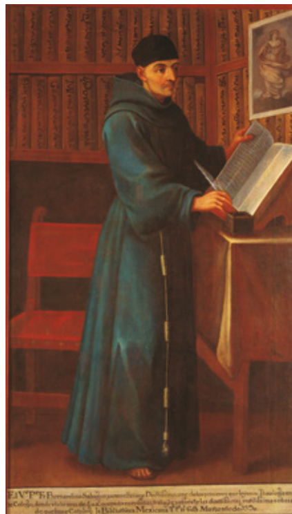
Fray Bernardino de Sahagún, primer antropólogo en tierras americanas, se asomó con mirada y oídos atentos a la historia que se empezaría a escribir.

Además de la historia, la literatura y la antropología, otras disciplinas como la arqueología también estuvieron en efervescencia, misma que produjo uno de los primeros documentos arqueológicos, que un buen lector de acontecimientos en aquellos días podría haber previsto que anunciaba una nueva era, ese libro que apareció en su Edición Príncipe de 1792 bajo el título Descripción histórica y cronológica de las dos piedras , que da cuenta del hallazgo en la Plaza Mayor, el 13 de agosto de 1790, de la Coatlicue y la Piedra del Sol, llamada también Calendario Azteca. De ahí que colocáramos este acontecimiento editorial en el centro de la exposición. De esta obra se realizó una edición facsimilar en 1990, doscientos años después del hallazgo, aunque para el facsímil sirvió de base la edición de 1832. Esta publicación y, desde luego el hallazgo, causó controversia y la decisión de los frailes universitarios que determinaron no exhibir la Coatlicue para no inquietar a los estudiantes, ya que suponían que la escultura resultaba incomprensible para quienes asistían a las cátedras por esos años. Pero la guerra de independencia tocaría muy pronto las puertas de la capital en 1810, y 15 años después, en 1825, un decreto dio fundamento legal al Museo Nacional , aunque por mucho tiempo no contará con casa propia. No obstante, en sus gabinetes se reunían los sabios de la época y como era de esperarse, unos años después, en 1827, ve la luz