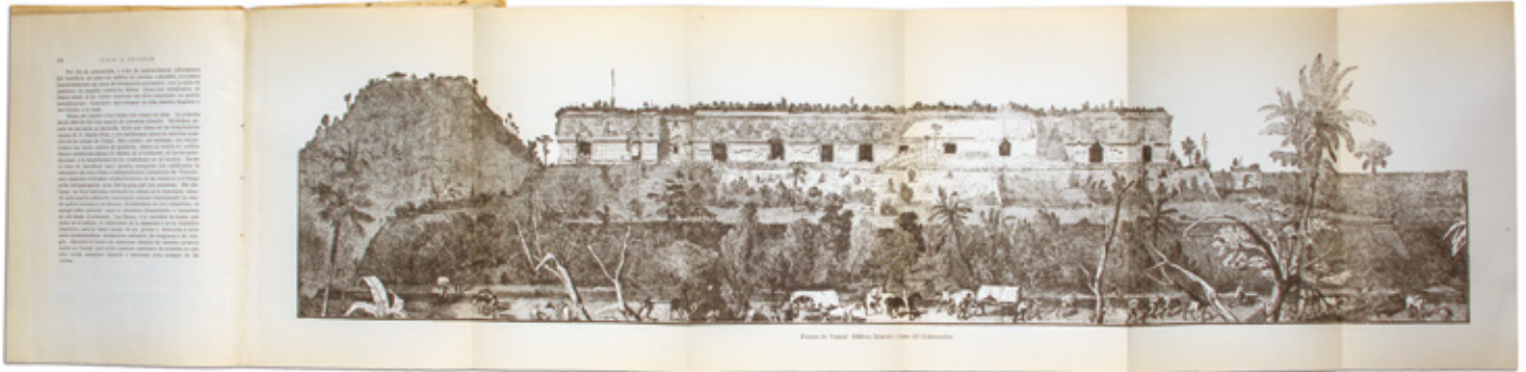
CAT. 29 John L. Stephens Viaje a Yucatán 1841-1842 1937 México, Imprenta del Museo Nacional de Arqueología, Historia y Etnografía