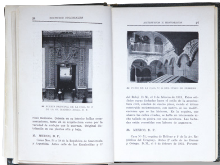
CAT. 76 Edificios coloniales, artísticos e históricos de la República Mexicana que han sido declarados monumentos 1939 México, Secretaría de Educación Pública, Instituto Nacional de Antropología e Historia