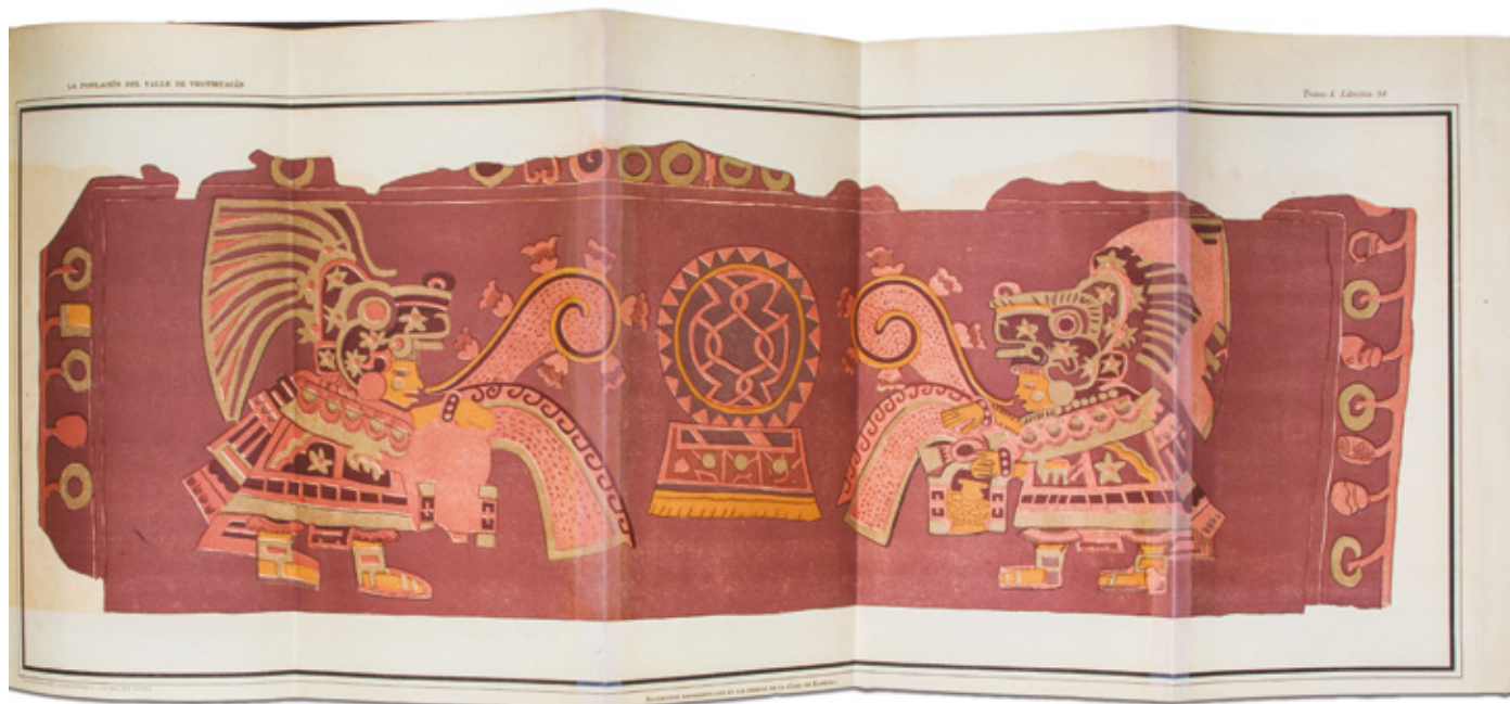
CAT 52 Manuel Gamio (director) La población del Valle de Teotihuacán 1922 México, Secretaría de Educación Pública