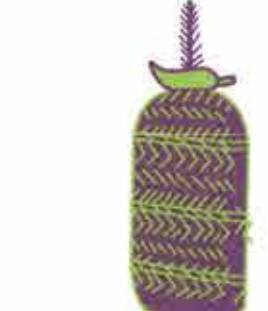
Cargas de chiles secos

Junto a la vitrina de Tributos, se encuentra la vitrina donde aparecen otros objetos que representan la llegada de los españoles en el siglo XVI, anota qué representa cada objeto: