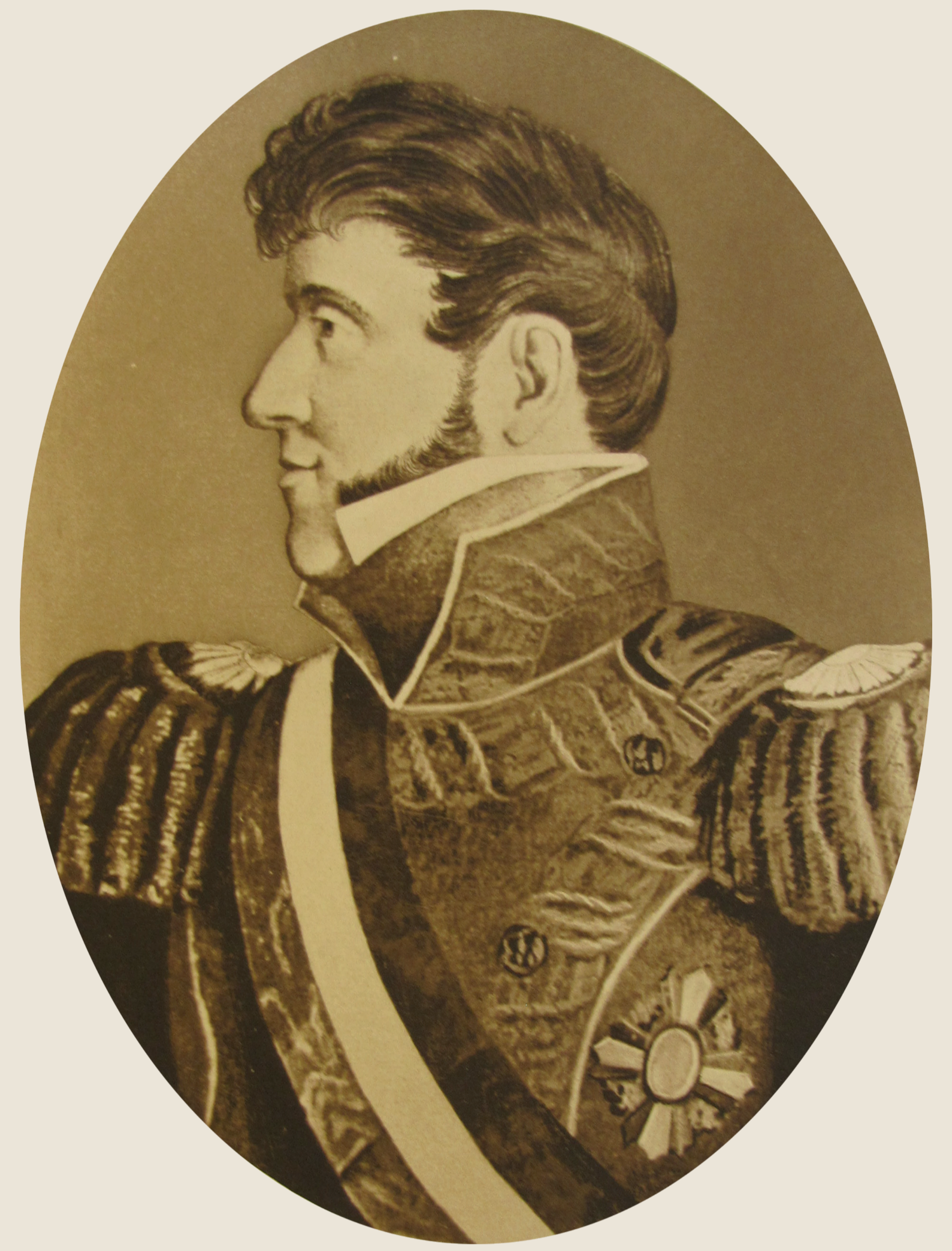
◆ Agustín de Iturbide

La primera Constitución que rigió a México fue la española de 1812 o de Cádiz. Esta Ley fundamental rigió en España y sus dominios –incluida la Nueva España– de 1812 a 1814 y de nuevo entre 1820 y 1823. Aunque el Imperio Mexicano obtuvo su independencia en 1821, la Constitución gaditana continuó en vigor mientras un Congreso Constituyente elaboraba una propia para México.