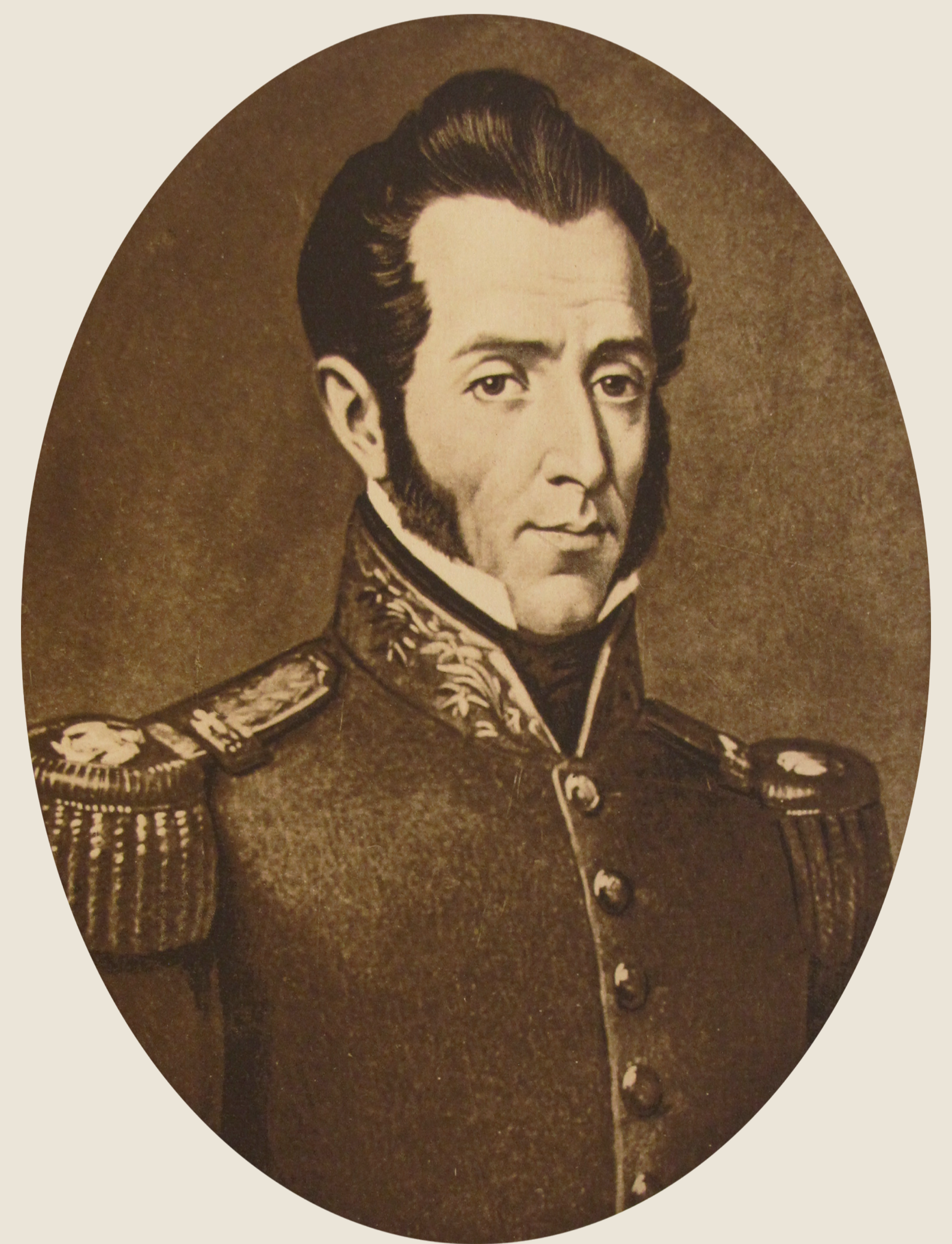
◆ Miguel Barragán

Fue la primera Constitución de México en establecer con pormenor con qué derechos individuales gozaría cada ciudadano mexicano. Y en un afán desmedido por evitar el abuso de poder creó un cuarto Poder Conservador, que debía vigilar al Ejecutivo, Legislativo y Judicial, lo que en la práctica se tradujo en entorpecer aún más la acción del Ejecutivo. Se le conoció como “Siete leyes” porque estaba dividida en siete apartados principales.