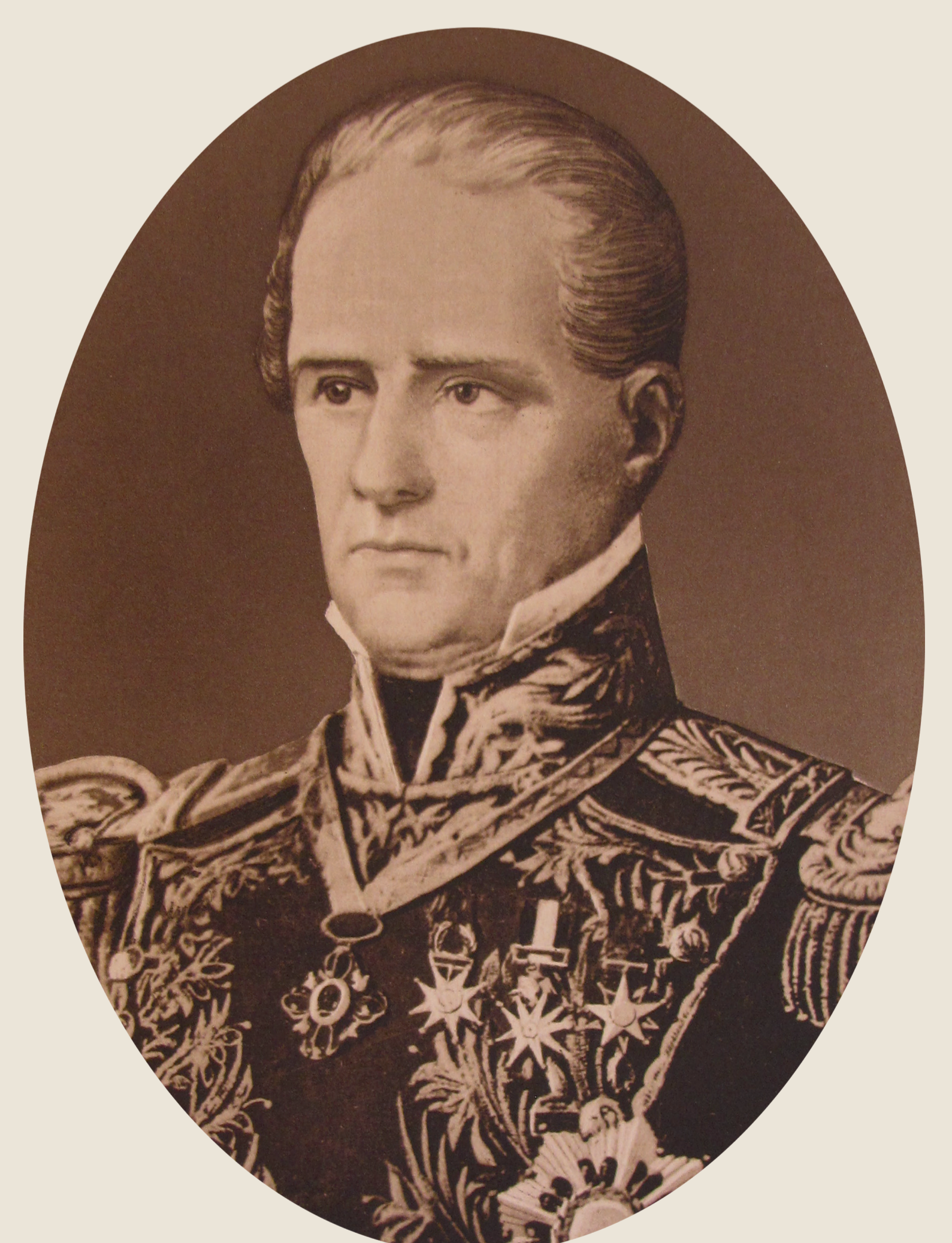
◆ Antonio López de Santa Anna

Este texto constitucional derogó el Supremo Poder Conservador, retomando la división en sólo tres poderes. Esta Ley fundamental fue la primera en establecer en México un sistema presidencialista, como el que actualmente rige a nuestro país. El presidencialismo consiste en que el Ejecutivo decide qué políticas van a dirigir la marcha del gobierno. La Constitución de 1843 era presidencialista porque en ella se daba al Ejecutivo la facultad para vetar las disposiciones del Legislativo en caso de que así lo considerara necesario. 🔄