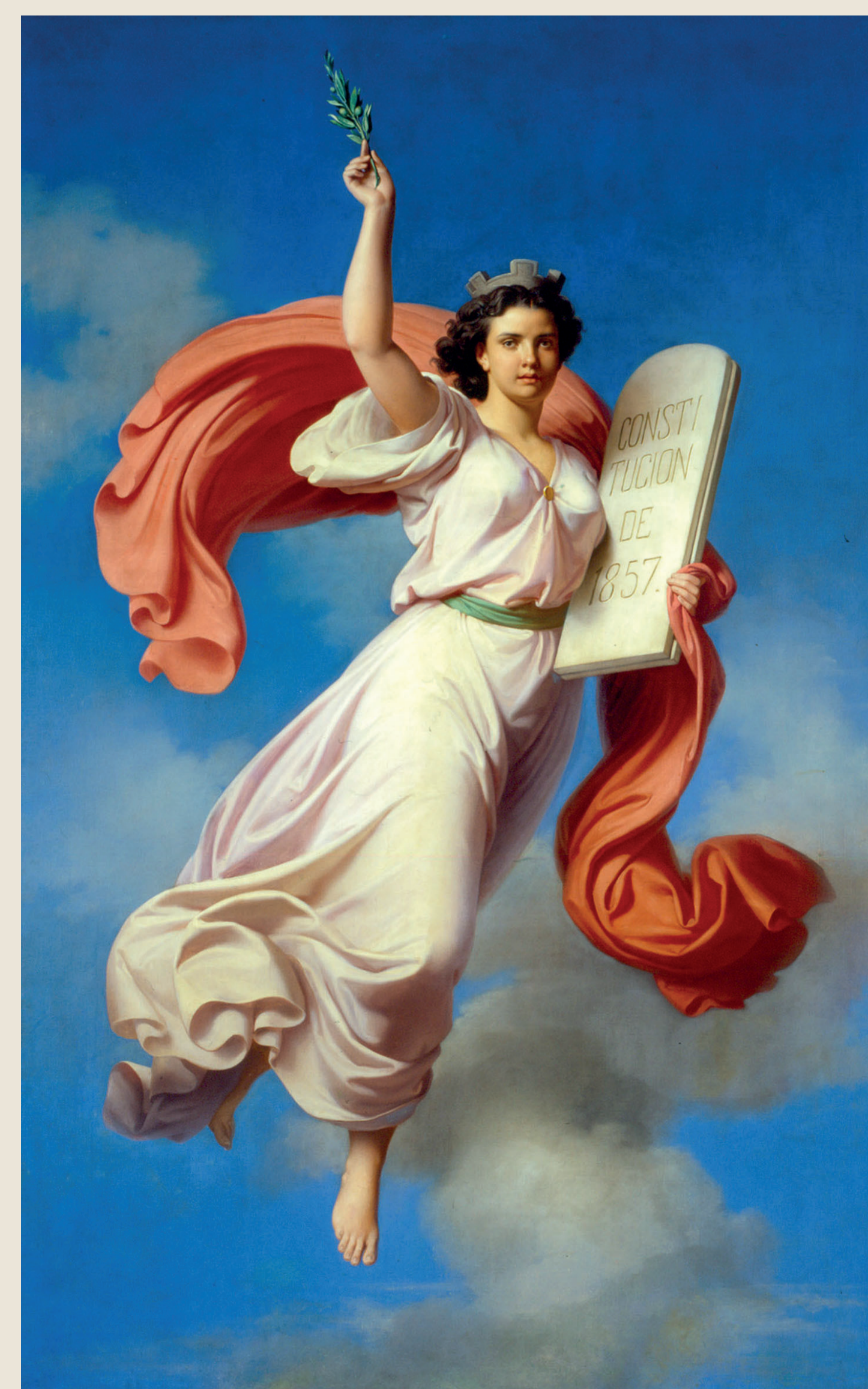
◆ Alegoría de la Constitución de 1857. Petronilo Monroy, óleo sobre tela, 1868