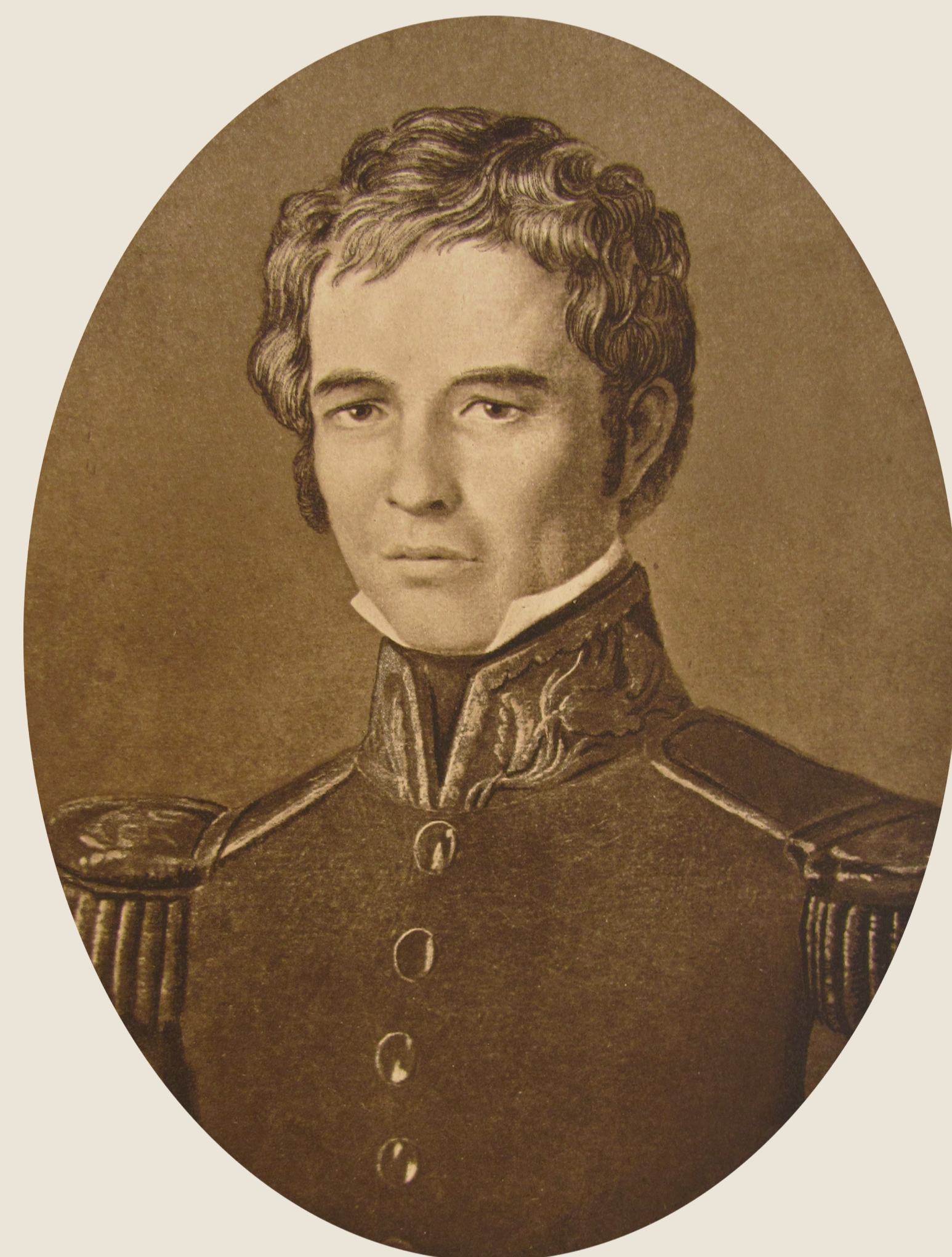
◆ Guadalupe Victoria

La Constitución de 1824 estableció un sistema en el que el Legislativo –formado por una cámara de diputados y otra de senadores– tenía más facultades que el Ejecutivo –detentado por un presidente, un vicepresidente y gobernadores estatales electos cada cuatro años–. Este régimen dio además a los estados la facultad de organizar cuerpos de Milicia Nacional Local o Cívica, que sirvieran como reserva para el Ejército en caso de invasión, pero que en la práctica fueron utilizadas por los gobiernos estatales para desafiar al Ejecutivo federal.