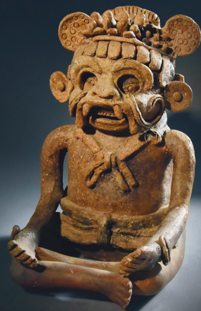
Figura antropomorfa con máscara de jaguar-murciélago