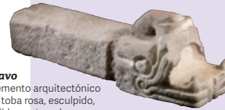
Clavo Elemento arquitectónico en toba rosa, esculpido, pulido y estucado. Representa la cabeza de una serpiente.