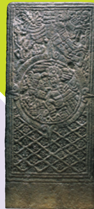
Estela Guerrero Itzpapálotl Monolito de piedra gris de basáltico tallada en relieve. 900-1200 d.C. Material: Basalto

En la sala podrás disfrutar de la única estela en piedra de Mesoamérica con la representación de la diosa Itzpapálotl, la cual fue encontrada en El Cerrito. De igual forma, se puede observar una línea del tiempo con los principales sitios toltecas de Mesoamérica: Tula Chichén Itzá, Tututepec y El Cerrito.