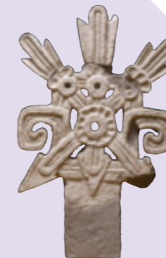
Remate arquitectónico dardos cruzados Elemento arquitectónico de toba lítica leucocrática en bajorrelieve. 900-1200 d.C. Material: Toba.

En el interior de un pequeño altar fue descubierta, por arqueólogos, una ofrenda dedicada a la diosa Itzpapálotl, formada por sahumadores de mano, en cuyo interior fueron quemadas puntas de sílex blanco, cuentas con forma de cráneos, cuentas de concha y tubillos de obsidiana.