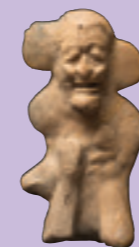
Anciano Figurilla antropomorfa masculina de cuerpo completo, muestra el rostro de un anciano, aparenta tener las piernas dobladas sobre el pecho.