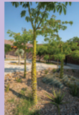
Ceiba Estos árboles forman parte del entorno natural actual, y en su momento representaron elementos terrenales del espacio sagrado.